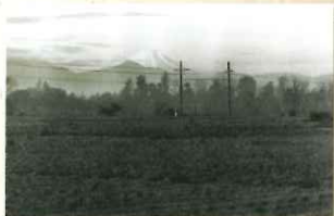
やくば（市役所）付近には大きな建物もなく富士山が良く見えていた。（昭和30年代）

ここでいう「むかしのくらし」は、主に明治から国立市になる昭和42年までをさします。