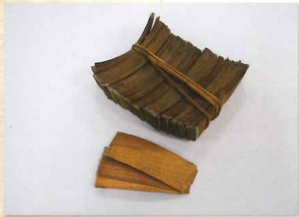
付け木 松やヒノキの薄い木の端に燃えやすい硫黄をぬりつけ、火を他にうつすのに使った。マッチが普及してからは使用されなくなった。