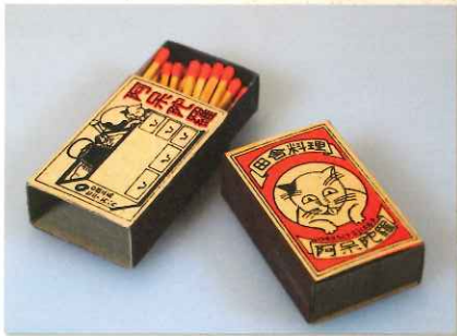
マッチ 木の棒の先にリンなどの燃えやすい物質をつけたもの。