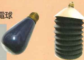
灯火管制用電気の傘

戦争中、夜も敵の飛行機が飛んできました。家の窓から明かりがもれているとその明かりを目標に攻撃されました。そのため電球に布や紙でかさをつけて、横から光がもれないように工夫をしたり、また下だけに明かりが出るようにした電球も使われました。