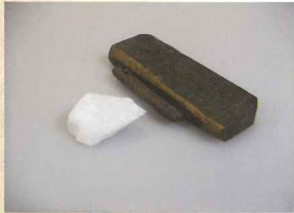
火打ち石 火打ち金 火打ち石と火打ち金を打ち合わせて火花をだし、火をつける道具。石はかたい石を使った。

マッチやライターがまだないころ、火をつけるには、火打ち石と火打ち金を打ち合わせ、火花をだして火を起こさなければいけません。日本ではじめてマッチが作られたのは、明治のはじめごろで、その後、大正・昭和と家庭に広まりました。