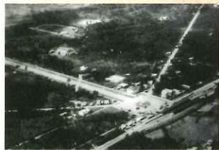
大正15年に国立駅ができた。 国立駅付近空撮（昭和2年頃）