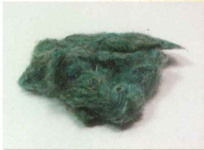
火口 (火口) 火打ち金と火打ち石から出した火花の火を大きくするためのもの。燃えやすい素材で、麻やガマの穂を使ったものなどがある。