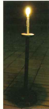
ろうそくを立てて使った。

ランプは朝になると燃えカス、ススでホヤ（ガラス部分）が真っ黒になっちゃう。きれいにするには、そのホヤをはずして布でのごしごしします。それは子どもたちの仕事でした。