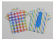
折り紙 （シャツのメッセージカード）