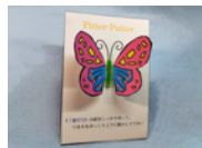
動く紙工作 （バタリンチョウ）