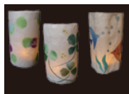
ちぎり絵 （和紙でランプシェードを作る）