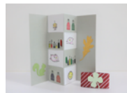
ペーパークラフト （マジックカード）