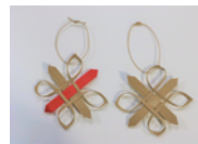
エコクラフト （オーナメント）