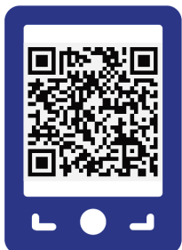
くにたち郷土文化館 HP

お申込みの問い合わせは、くにたち郷土文化館までお電話 (☎ 042-576-0211) ください。