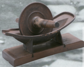
左：活人録 右：薬研 背景：旧本田家住宅（昭和30年代） いずれも本田家旧蔵資料・国立市所蔵