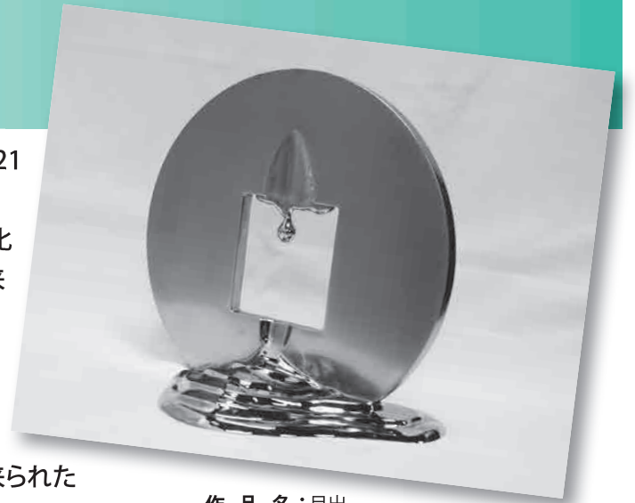
作品名：月出 作家名：金 景賢 KIM Kyong-Min 素材：ステンレススチール

その結果、市民賞受賞作品は、最多得票333票を得た、金景賢(キムキョンミン)「月出」に決定しました。