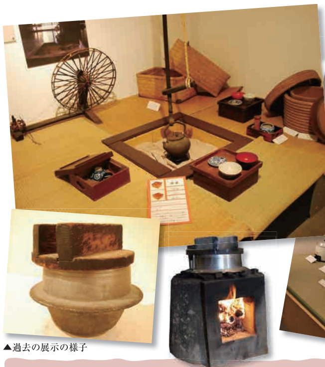
▲過去の展示の様子

2015年1月10日(土)～3月16日(月) ※休館日:毎月第2・4木曜日 入場無料