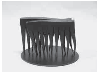
作品名：ZORO² 作家名：岡村 光哲 Kotetsu OKAMURA 素材：ステンレス