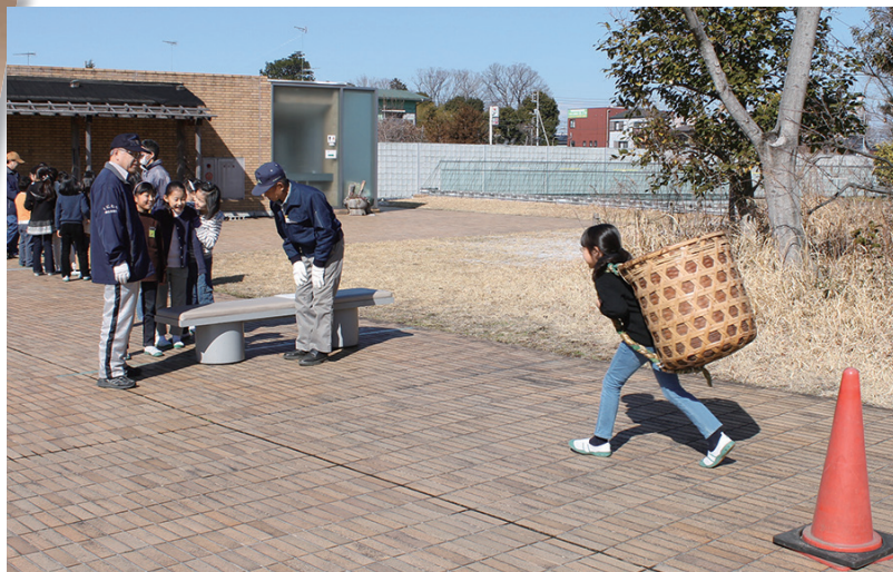
▲過去の民具案内のようす