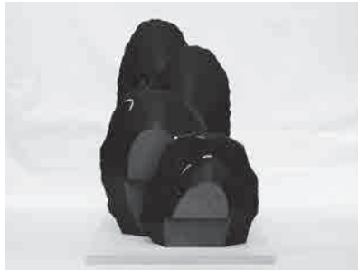
作品名：進化景色(都市の森) 作家名：土田 義昌 Yoshimasa TSUCHIDA 素材：黒御影石