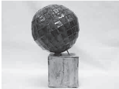
作品名：風の球体 作家名：チーム美山 Team BIZAN 素材：陶(鉄筋/タイルメント)

さて、この展示会開催期間中の11月17日(月)、くにたち郷土文化館にて、選考会委員による第二次選考も行われ、いずれも優れた15作品の中から協議を重ねた末、5点の作品が選ばれました。