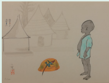
木版画「大地の子(カメルーンにて)」2006年