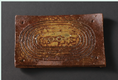
焼しめ皿「マサイ文」1970年