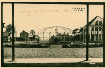
絵葉書: 一路多摩川へ(国立駅より) 昭和2(1927)年