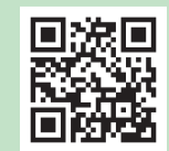
収蔵資料データベース