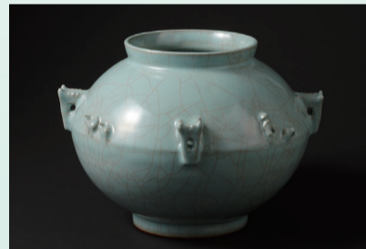
青磁花瓶「シルクロード」1987年