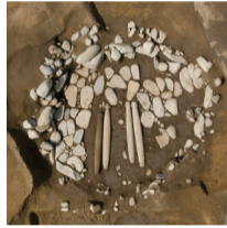
緑川東遺跡 敷石遺構