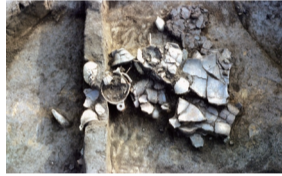
南養寺遺跡 6号住居跡 遺物出土状況