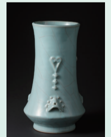
青磁花瓶「地中海」1989年