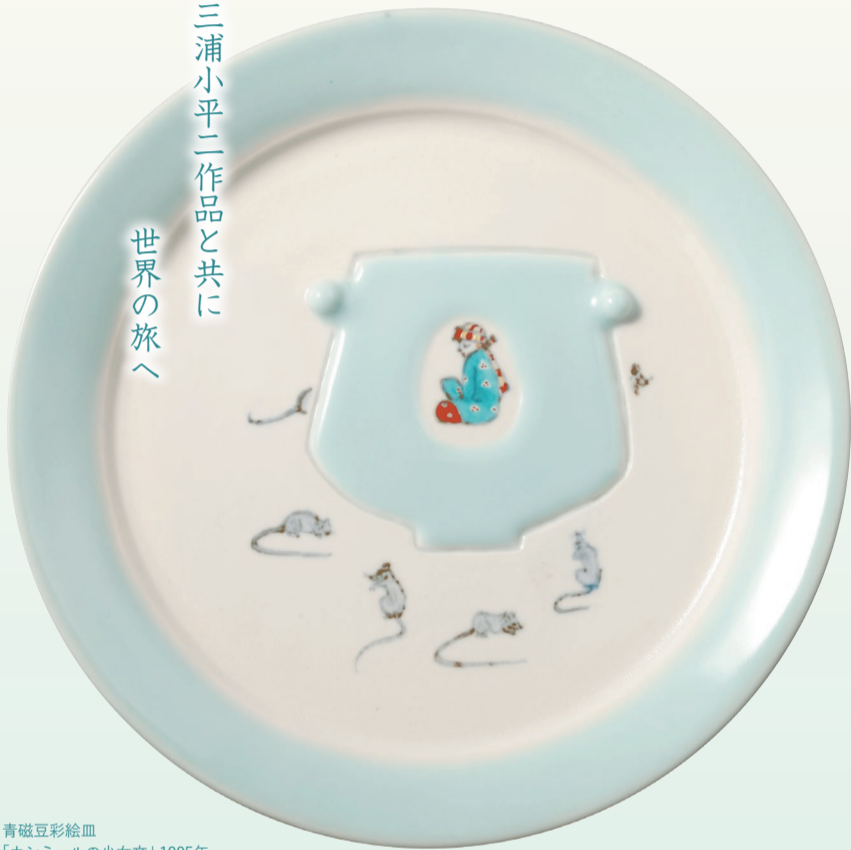
青磁豆彩絵画 「カシミールの少女文」1995年

三浦小平二は、青磁に絵付けをするなどオリジナルのスタイルが海外で評価され、1997年には青磁で重要無形文化財保持者（いわゆる「人間国宝」）に認定された陶芸家です。2006年に国立市の自宅で逝去されたのち、2007年に竹子夫人より国立市に多くの作品が寄贈されました。