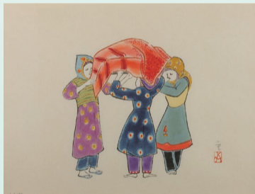
木版画「仲良し(イエメンにて)」2006年