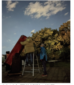
2019年天体観測の様子